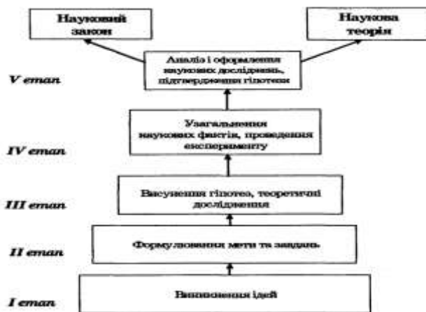
Схема 1. Головні етапи наукового дослідження.